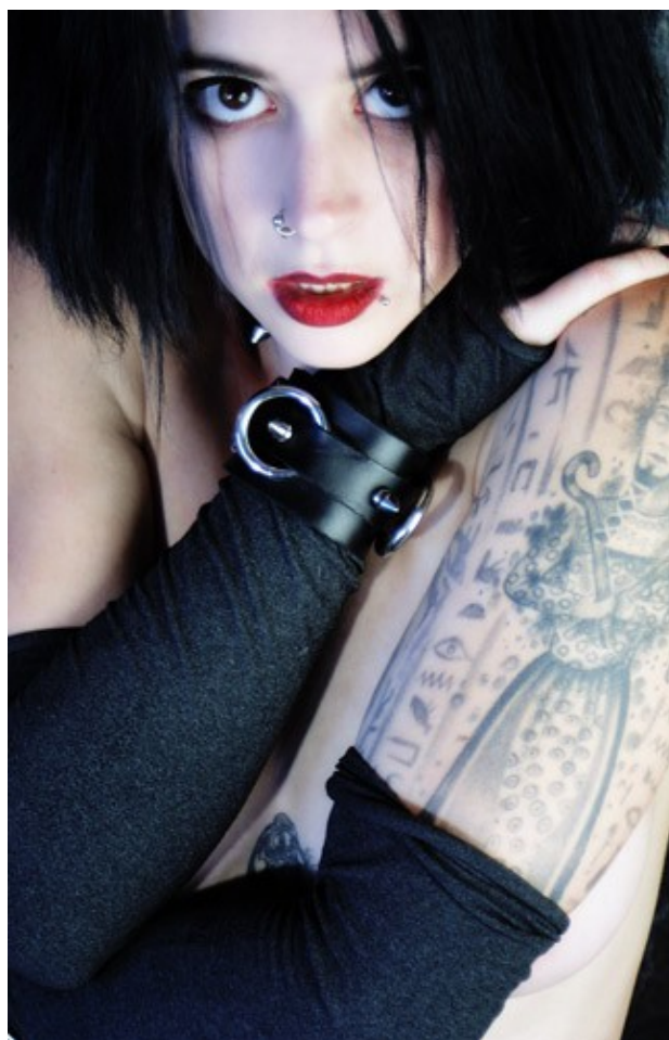
Fig. 1 Fractal "Shock Me", Suicide Girls.